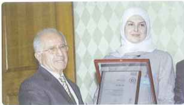
أثناء تسليم الشهادة