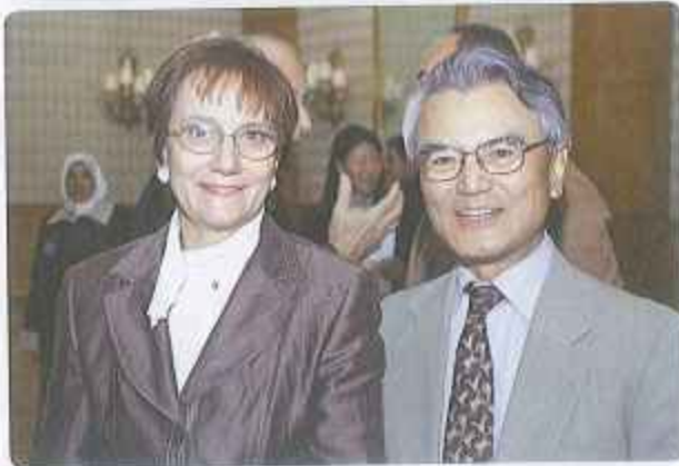
سفير اليابان و عشيقته